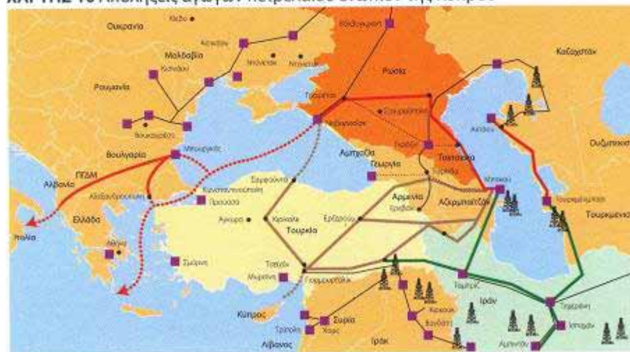
ΧΑΡΤΗΣ 10 Απολήξεις αγωγών πετρελαίου ενώπιον της Κύπρου

Πηγή Γεωστατική πληροφορία και χωροθέτηση σταθμών: I.G. Μόλις Χαρτογράφηση: I.G. Μόλις & Γ. Σουλίου