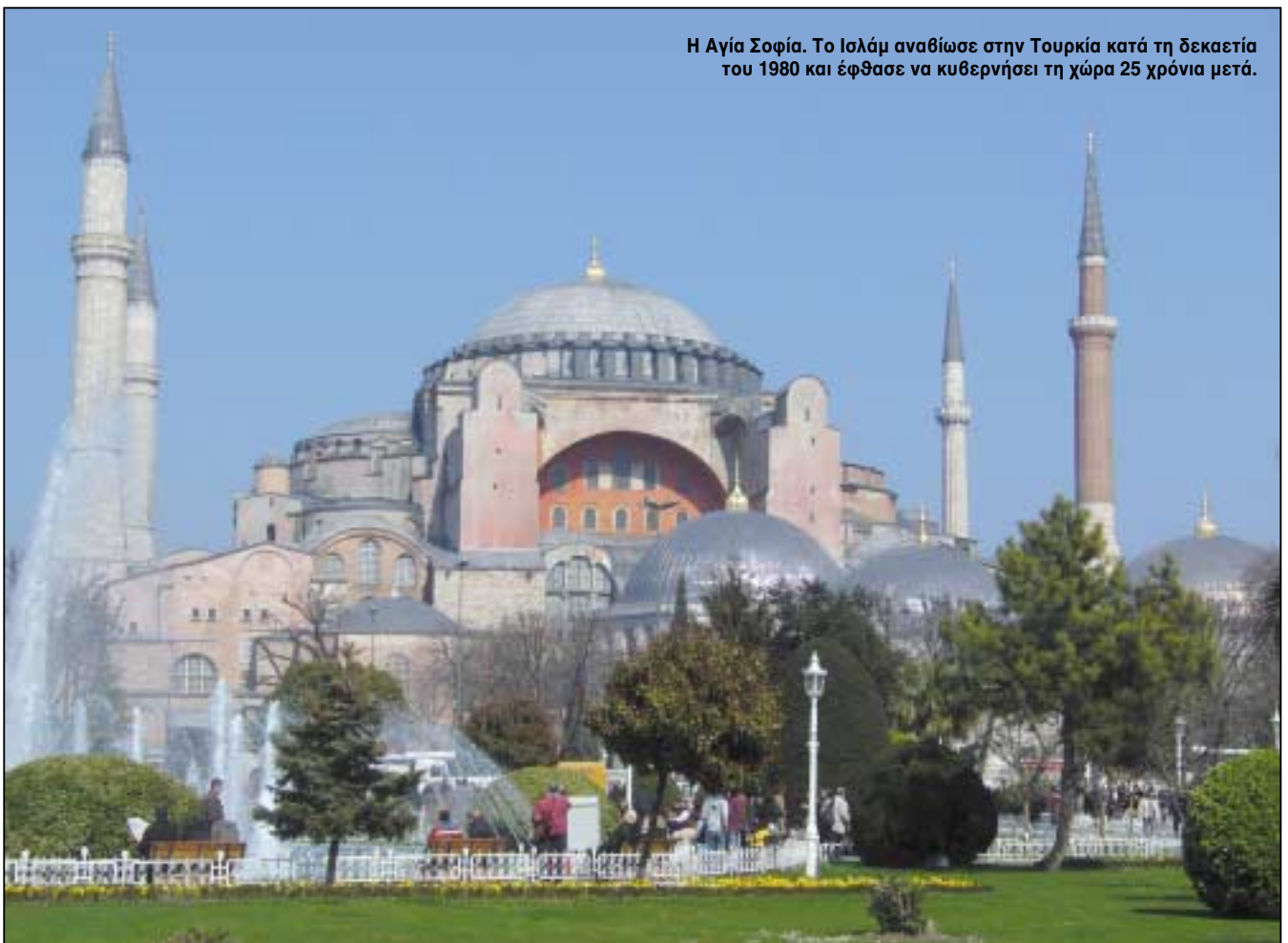
Η Αγία Σοφία. Το Ισλάμ αναβίωσε στην Τουρκία κατά τη δεκαετία του 1980 και έφθασε να κυβερνήσει τη χώρα 25 χρόνια μετά.

Εδώ λοιπόν καταρρέει, για μια ακόμη φορά, το όραμα του Χ. Γιανναρά, από τους ίδιους τους μελλοντικούς συν-υλοποιητές του. Κι αυτό γίνεται ακόμη πιο εμφανές από το γεγονός του ισχυρού τουρκικού-εθνικιστικού και ισλαμιστικού χα-