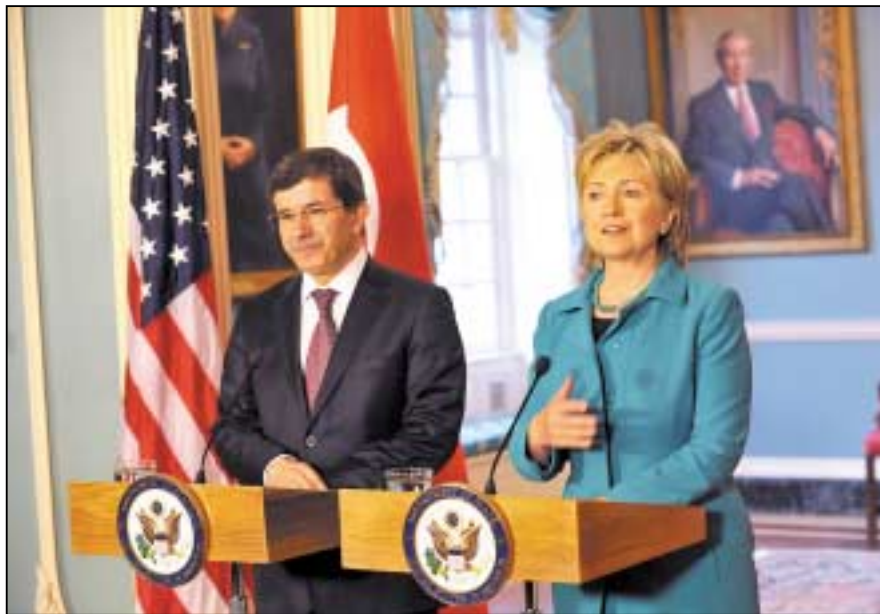
Α. Νταβούτογλου και Χ. Κλίντον. Ο νεο-οθωμανισμός συναντά την αμερικανική στρατηγική, λαμβάνοντας το πράσινο φως για μεγαλύτερη ελευθερία κινήσεων.

Δεύτερον, θα τεκμηριώσω ακόμη περισσότερο τη διαφορετική μου άποψη, ιδιαίτερος περί ισλαμικής τέχνης, προτείνοντας και πάλι το κείμενο του αρχιεπισκόπου πάσης Αλβανίας Αναστασίου, ο οποίος αναφέρει ότι, λόγω της θεολογικής αντιπαράθεσης περί Αγίων Εικόνων, το Ισλάμ οδηγήθηκε σε μια άλλη μορφή αισθητικής «δυναμικών σχημάτων και γραμμών (...) η οποία εκαλλιεργήθη με εξαιρετική ευαισθησίαν και δεξιοτεχνίαν (...) η οποία γοητεύει και εκστασιάζει. Η μου-