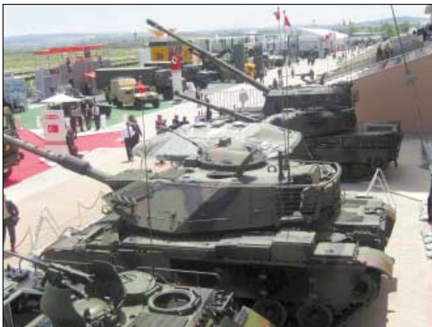
Η Τουρκία είναι μέλος της G-20 και έχει στηρίξει την οικονομική της ανάπτυξη στην οικοδόμηση ισχυρής πολεμικής βιομηχανίας.

πρότεινε «τον προσανατολισμό προς τον Μουσουλμανικό κόσμο των χιλίων εκατομμυρίων». Ο Νταβούτογλου χαράσσει σήμερα την τουρκική πολιτική ακριβώς με αυτές τις βάσεις και αυτήν ακριβώς την «κρυφή ατζέντα». Οσο για την ικανοποίηση των αντισημιτικών αισθημάτων των οπαδών του Τ. Ερντογάν, μέσω των οδηγίων Νταβούτογλου, αρκεί να θυμίσω τη σκαιά συμπεριφορά του Ερντογάν έναντι του γηραιού Ισραηλινού προέδρου στο τελευταίο Νταβός.