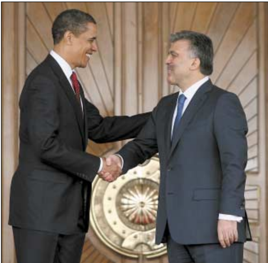
Οι πρόεδροι Ομπάμα και Γκιούλ ανταλλάσσουν χειραψία. Η αναβάθμιση της γεωπολιτικής θέσης της Αγκυρας από τις ΗΠΑ αποτέλεσε μια αναμενόμενη εξέλιξη.

μπορούμε να συζητήσουμε και τι νόημα θα είχε; Θα το πράξουμε όμως αμέσως, από επιστημονικό καθήκον.