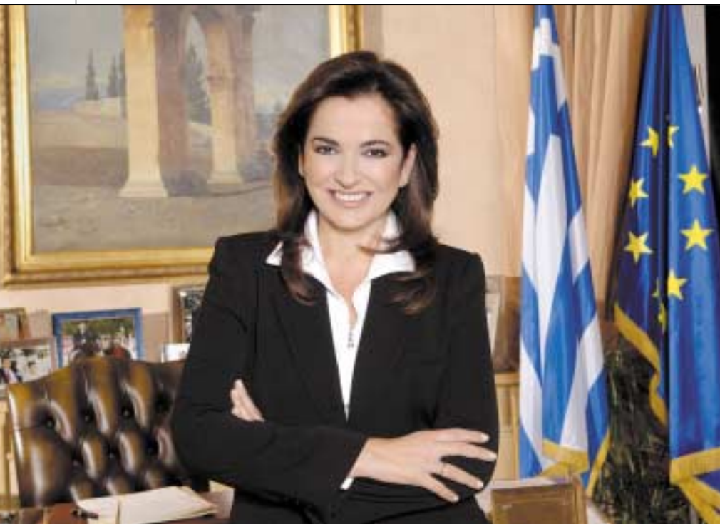
Η πρώην υπουργός Εξωτερικών της Ελλάδας, Ντόρα Μπακογιάννη, με την πολιτική που άσκησε έναντι της Τουρκίας έδωσε αφορμή για σοβαρές παρανοήσεις και μετέδωσε λάθος μηνύματα στο εσωτερικό και στο εξωτερικό.

Η πολιτική σκέψη των ισλαμιστών διανοούμενων στην Τουρκία θεωρεί την κοσμική εκπαίδευση ως «υπεύθυνη των πάσης φύσεως στρεβλώσεων και διαφθοράς, ότι κατέστρεψε το σεβασμό του τουρκικού λαού προς την εξουσία και την ηθική πειθαρχία που προηγουμένως αποτελούσαν σημαντικά στοιχεία της κουλτούρας και τα οποία μεταδίδονταν στις επόμενες γενεές μέσω της οικογένειας (σ.σ. της τουρκο-οθωμανικής), της παράδοσης, των εθίμων και της θρησκευτικής πίστωσης του Ισλάμ». Σύμφωνα με τη λογική αυτή, «η τουρκική νεολαία των δεκαετιών 1960 και 1970 αποξενώθηκε από την εθνική κουλτούρα, αγνόησε την ίδια την εθνική ιστορία, παρασύρθηκε σε ξένες ιδεολογίες, επανεστάτησε εναντίον της εθνικής (τουρκικής) εξουσίας, έχασε τις ρίζες της και περιήλθε σε σύγχυση χωρίς καμία ελπίδα» (23).