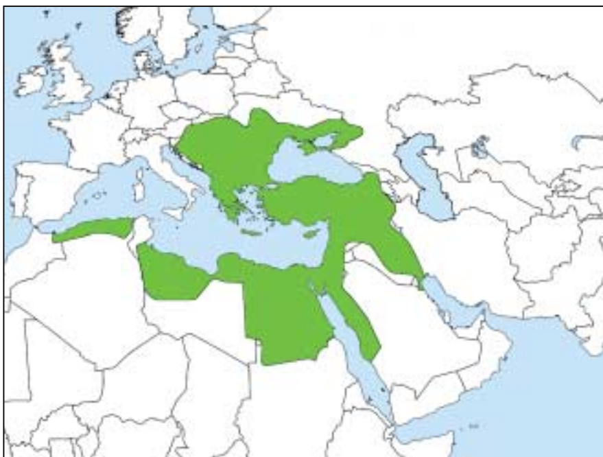
Η Οθωμανική αυτοκρατορία το 1566. Στις ημέρες μας στην Τουρκία γίνεται μια επαναξιολόγηση του οθωμανισμού. Δεν πρόκειται απλώς και μόνο για μια ιδεολογία αλλά για διαφορετικές γεωπολιτικές συνθήκες. Το αποτέλεσμα είναι ένας παν-τουρκικός νεο-οθωμανισμός.

ξίας ισλαμικού πολιτισμού». Αρα καταρρίπτεται επίσης και ολόκληρο το λογικό οικοδόμημα που έκτισε ο συνάδελφος επάνω του! Παραδόξως, φαίνεται ότι ο Χ. Γιανναράς επιλέγει να θυσιάσει -τουλάχιστον στα γραφόμενά του- αυτό που μέσα του θεωρεί τόσο κατάλληλο ως αιγίδα, θα λέγαμε, για τον δήθεν «παρακμάζοντα» Ελληνισμό, τ.έ. το Ισλάμ, υποστηρίζοντας ότι δεν διαθέτει πολιτισμό, προκειμένου να το καταστήσει «ακίνδυνο» στα μάτια των αναγνωστών του. Είναι σαν να μας λέει: «Μη διστάζετε να δεχθείτε την επικυριαρχία του Ισλάμ, αφού δεν θα αλλοιώσει τίποτα από τα εθνικά σας χαρακτηριστικά, τα οποία ούτως ή άλλως έχετε απολέσει. Με το Ισλάμ και συνεπώς με την απεμπόλιση κάθε δυτικού στοιχείου απλώς θα τα ξαναβρείτε»!