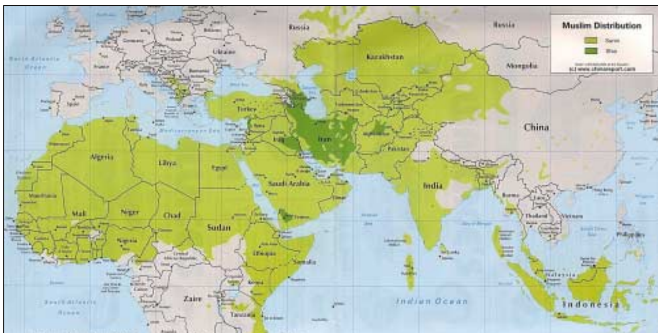
Ο ισλαμικός κόσμος (Σουνίτες και Σίιτες). Η Τουρκία φιλοδοξεί να αποκτήσει κυρίαρχο ρόλο σε αυτόν, εκμεταλλευόμενη την αναβάθμιση της γεωστρατηγικής της αξίας.

Turkei zwischen Europa und dem Islamismus , Diana Verlag, München-Zürich, 1998, s. 69.