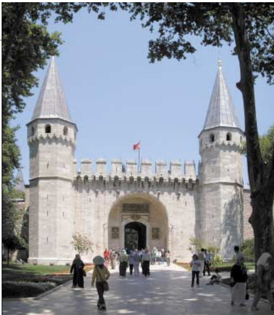
Τα ανάκτορα του Τοπ Καπί. Ο Τουργκούτ Οζάλ, μίλησε περί ευκαιριών οι οποίες παρουσιάζονται κάθε τριακόσια χρόνια και εξήγησε ότι «η παρούσα ιστορική συγκυρία δίνει τη δυνατότητα στην Τουρκία, διά της ενεργοποίησης των μουσουλμανικών μειονοτήτων στην Αλβανία, στη Γιουγκοσλαβία, στη Βουλγαρία και στην Ελλάδα να αναστρέψει την πορεία συρρίκνωσης της, η οποία ξεκίνησε προ των τειχών της Βιέννης».

Αναφορικά δε με τον καλπασμό του Ισλάμ στην Τουρκία, ο καθηγητής Amikam Nachmani αναφέρει (με στοιχεία 2003) ότι περίπου 1.500 νέα τεμένη κτίζονται κατ' έτος και μέχρι το 2003 στην Τουρκία υπήρχαν ήδη 80.000 μουσουλμανικά τεμένη, πράγμα που μας δίδει την αναλογία ενός τεμένου ανά 800 Τούρκους πολίτες! Συμπληρώνει μάλιστα ότι τα μεγέθη αυτά αναδεικνύουν τη θρησκευτική ισχύ του τουρκικού Ισλάμ απέναντι στην ανίσχυρη πολιτικά κεμαλιστική τάση (1).