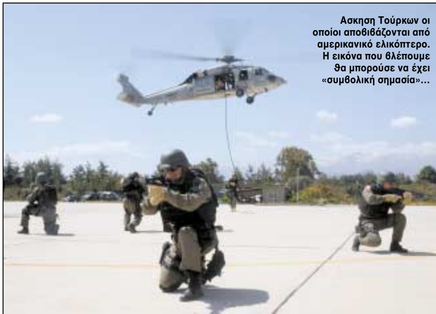
Ασκηση Τούρκων οι οποίοι αποθιβάζονται από αμερικανικό ελικόπτερο. Η εικόνα που βλέπουμε θα μπορούσε να έχει «συμβολική σημασία»...

Αναρωτιέμαι ακόμα πώς τη γλίτωσε ο Ελληνισμός τετρακόσια ολόκληρα χρόνια από τούτη την «οντολογική συναίσθηση»! Και προσπάθησαν επαρκώς να μας την «κοινωνήσουν», επίσης, αυτή την «ισλαμιστική καθολικότητα», μάλιστα με τους πλέον συστηματικούς εκτουρκισμούς, οι οθωμανοί κυρίαρχοι! Νομίζω...! Δεν ορρωδήσαν μάλιστα ούτε στη χρήση της «λαϊκής κουλτούρας της Ανατολής», δηλαδή των ετερόδοξων δερβισικών Ταγμάτων, όπως οι Μπεκτασιήδες, για να επιτύχουν τους εκτουρκισμούς τους αυτούς. Επ' αυτού όμως θα επανέλθω παρακάτω, για να διαλύσω τον μύθο περί «λαϊκού πολιτισμού της Ανατολής» στον οποίο βασίζεται ένα μέρος της συλλογιστικής του Χ. Γιανναρά.