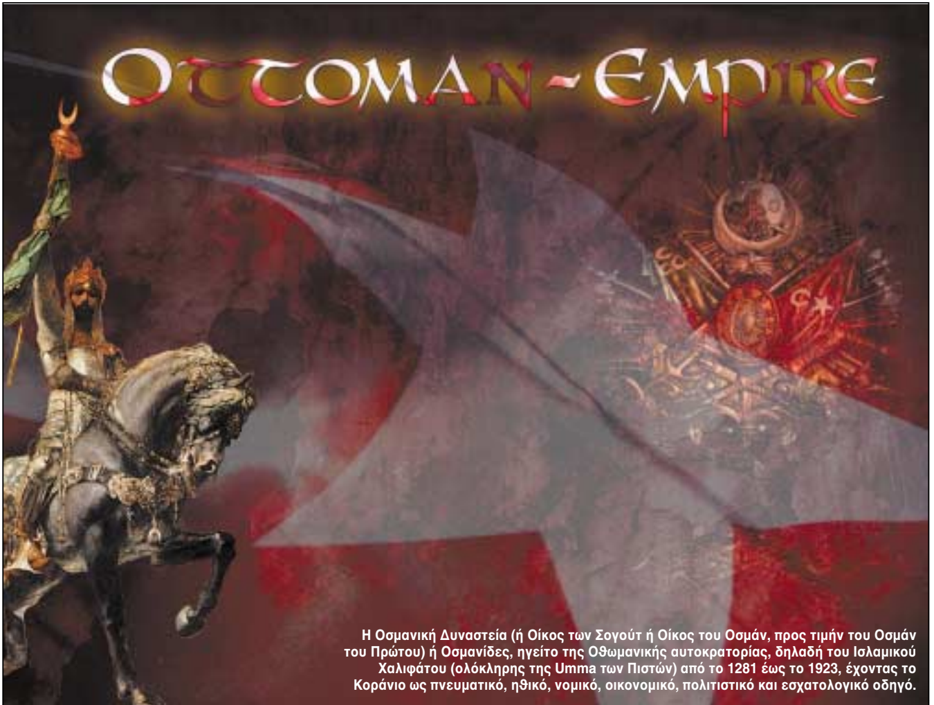
Η Οσμανική Δυναστεία (ή Οίκος των Σογούτ ή Οίκος του Οσμάν, προς τιμήν του Οσμάν του Πρώτου) ή Οσμανίδες, ηγείτο της Οθωμανικής αυτοκρατορίας, δηλαδή του Ισλαμικού Χαλιφάτου (ολόκληρης της Υπμα των Πιστών) από το 1281 έως το 1923, έχοντας το Κοράνιο ως πνευματικό, ηθικό, νομικό, οικονομικό, πολιτιστικό και εσχατολογικό οδηγό.

ψουμε, επαναλαμβάνω, τον εξανδραποδισμό μας στον «άμοιρο πολιτισμό», όπως ο ίδιος ισχυρίζεται, νεο-οθωμανό ανατολίτη Δεσπότη για «να σώσουμε τον Ελληνισμό»! Μα κανένας πολιτισμός δεν σώζεται εντός του προαναφερθέντος «α-πολιτισμικού» περιβάλλοντος και επίσης κανένας πολιτισμός δεν σώζεται με επαιτεία! Μόνο με την ανθρώπινη πνευματική και πρακτική δράση, μάλιστα σε ελευθερία, αν πρόκειται για τον ελληνικό πολιτισμό! Ας θυμηθούμε τον θείο Διονύσιο Σολωμό! Και, κυρίως, ας μην αναμινύουμε τις όποιες τυχάρπαστες ελλαδικές «ελίτ» με τον Ελληνισμό! Δεν είναι απλώς λάθος, είναι έγκλημα! Μού έρχεται δύσκολο να τα λέω αυτά στον Χ. Γιανναρά, αλλά με υπερβαίνει η αριστοτελική λογική μου! Εύχομαι, ειλικρινά, να μην κατάλαβα τα γραφόμενά του! Το προτιμώ!