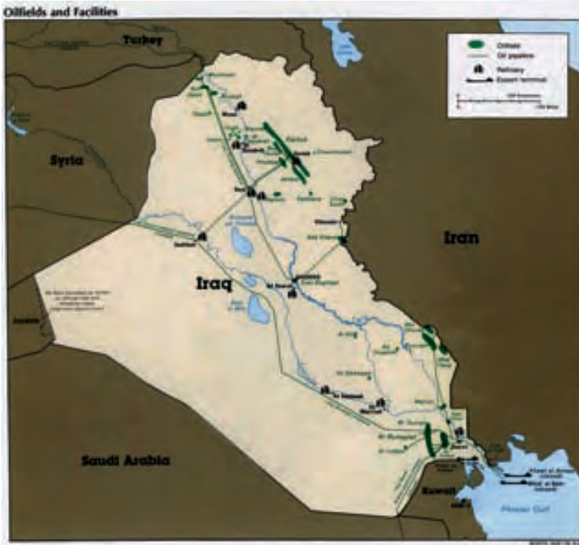
Χάρτης 7: Η Χανακίν αποτελεί την αρχή αγωγού πετρελαίου ο οποίος διοχετεύει το αντλούμενο αργό από το κοιτάσμα Naft Khaneh προς τα διυλιστήρια της Βαγδάτης.

ii) Ας αναφερθούμε τώρα στις εξελίξεις που προδιαγράφονται για το μπιαστικό καθεστώς του Μπασάρ αλ Άσαντ, μετά από το εκδοθέν πόρισμα της Επιτροπής Μέλεις, αναφορικά με τις ευθύνες του συριακού καθεστώτος στην δολοφονία του Πρωθυπουργού του Λιβάνου Ραφίκ Χαρίρι. Δυστυχώς, η αποσταθεροποιητική πίεση επί του καθεστώτος αυτού, την φορά αυτή έχει και τις ευλογίες της Ε.Ε. και ιδιαιτέρως της Γαλλίας η οποία έχει αναλάβει ουσιαστικώς από τις Η.Π.Α. μια δεύτερη «Εντολή» επί του Λιβάνου και αγωνιά να την εφαρμόσει καθιστώντας την «παραγωγική» για τα εθνικά της συμφέροντα.