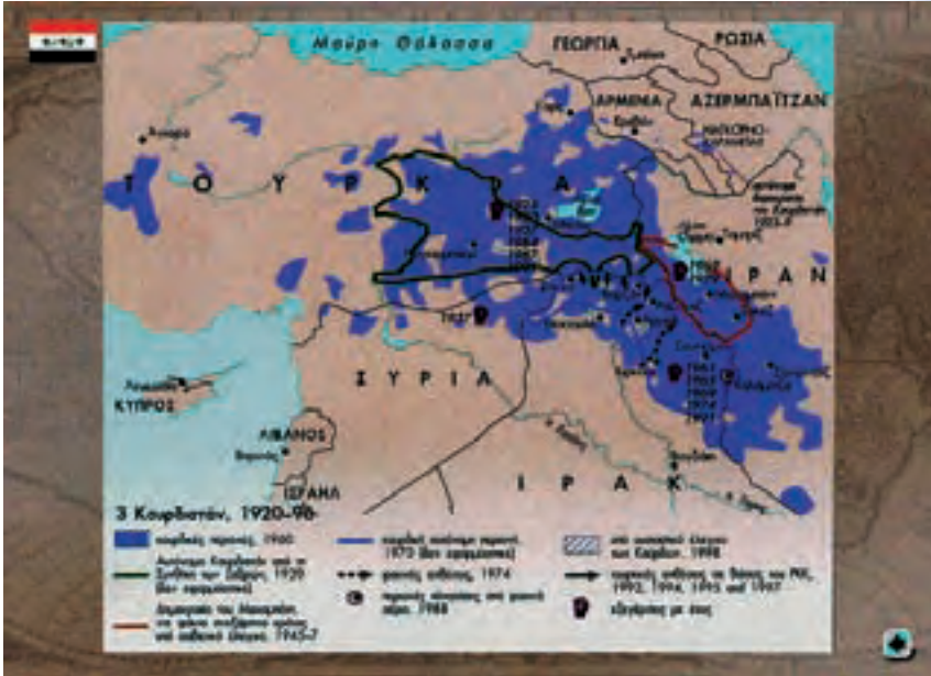
Χάρτης 5: Η πορεία του κουρδικού κράτους από το 1920-1996. Οι Κούρδοι δεν ελησιμύνησαν ποτέ τα καθεστώτα αυτονομίας τους στην Τουρκία και τις γειτονικές περιοχές.

Μερικές ακόμη παρατηρήσεις είναι, κατά την κρίση του γράφοντος εξαιρετικά χρήσιμες στον αναλυτή της γεωπολιτικής δυναμικής της περιοχής: