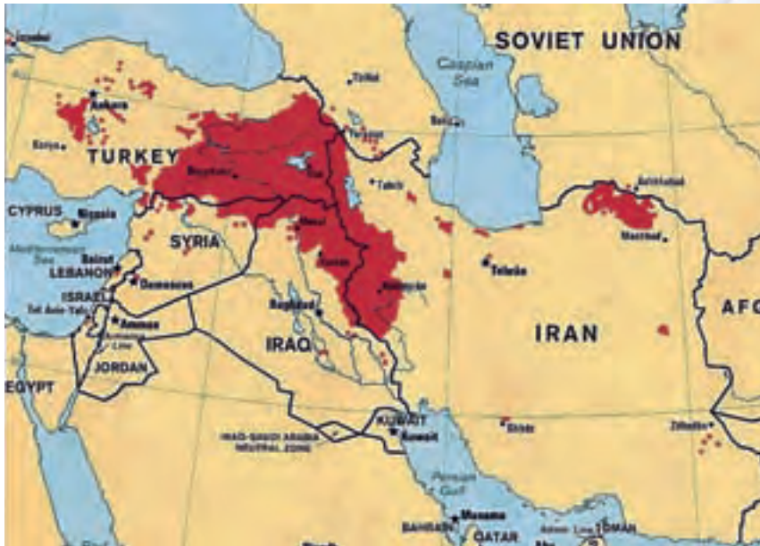
Χάρτης 3: Η διασπορά του κουρδικού στοιχείου στον μεσανατολικό χώρο, αλλά και στον χώρο της Κεντρικής Ασίας είναι σημαντικότερη.

τμήμα επικρατεί η «Δημοκρατική Ένωση του Κουρδιστάν» του νυν Προέδρου του Ιρακινού Κράτους κ. Τζελάλ Ταλαμπανί. (βλ. Χάρτες 3 και 4).