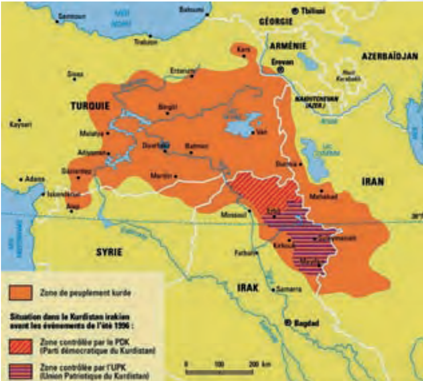
Χάρτης 4: Στο βόρειο τμήμα του ιρακινού Κουρδιστάν επικρατεί το «Δημοκρατικό Κόμμα του Κουρδιστάν» του Ιντρίς Μπαρζανί, ενώ στο νότιο τμήμα επικρατεί η «Δημοκρατική Ένωση του Κουρδιστάν» του Τζελάλ Ταλαμπανί.

Οι δηλώσεις αυτές του Κούρδου Προέδρου έγιναν εσχάτως στο τουρκικό κανάλι Ν.Τ.Υ. Έχει ενδιαφέρον να τονίσουμε ότι η πόλις αυτή βρίσκεται περίπου 140 km Β/Α/ της Βαγδάτης, ανήκει εις την επαρχία Ντιγιάλα, πληθυσμού 1.474.000 εκατ. κατ., το βόρειο τμήμα της οποίας ανήκει στα εδάφη του ημιαυτονόμου ιρακινού Κουρδιστάν και έχει [στην βόρεια αυτή ζώνη] κουρδικό πληθυσμό. Το κυριαρχούν δόγμα του Ισλάμ στην επαρχία είναι σουνιτικό και η πόλη βρίσκεται ουσιαστικά στα όρια της ζώνης όπου αρχίζει να ενισχύεται σημαντικά η σιιτική επιρροή επί των αραβικών πληθυσμών.