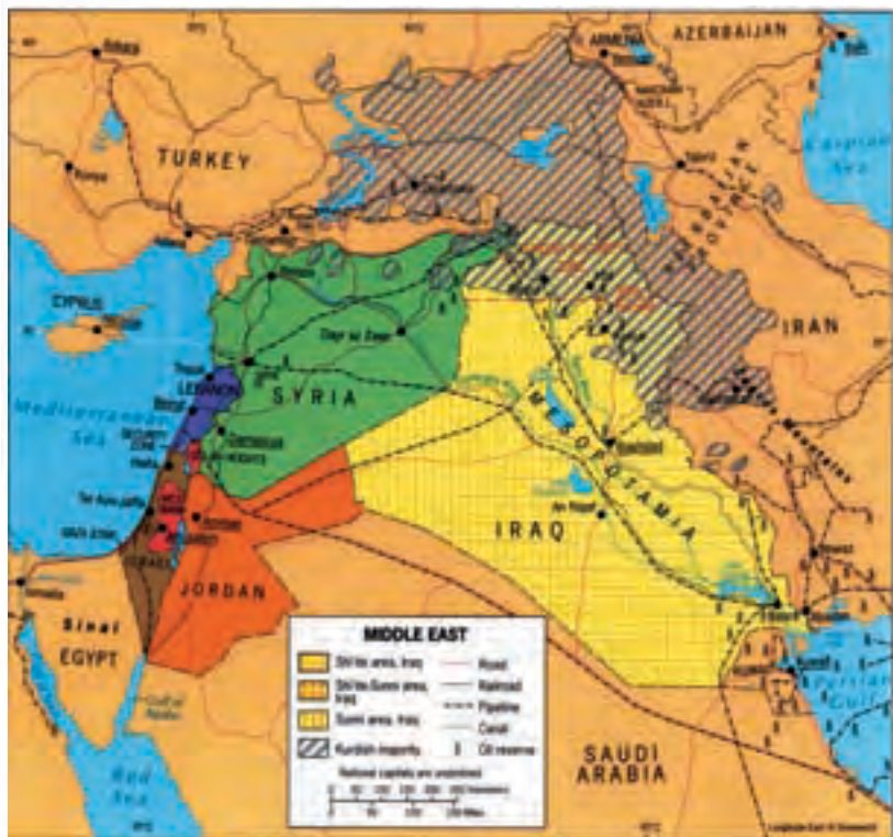
Χάρτης 1: Το Σουννικό στοιχείο εντοπίζεται αμιγές στο Βόρειο και Κεντρικό Ιράκ και αναμειγμένο με το Σιιτικό στοιχείο στο Νότιο Ιράκ, όπου εκεί το σιιτικό στοιχείο υπερισχύει.

Το κουρδικό στοιχείο στα εδάφη του Ιράκ διαθέτει ένα ποσοστό της τάξεως του 24,78%, δηλ. 5.600.000 άτομα, επί συνολικού ιρακινού πληθυσμού 22.600.000 ατόμων και καλύπτει έκταση 83.000 km 2 . Το κουρδικό στοιχείο είναι μεν σουννικό, αλλά στην περίπτωση του κατισχύει το εθνοτικό χαρακτηριστικό επί του θρησκευτικού.