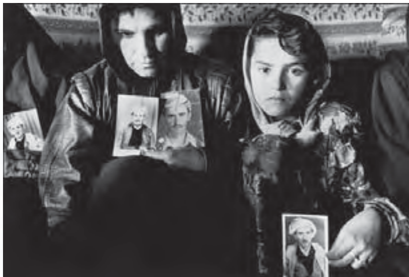
Κατά τη γενοκτονία της περιόδου 1987-89 εδολοφονήθησαν με χημικά όπλα, και όχι μόνον, περί τους 110.000 κούρδους.

Μόνο κατά τη γενοκτονία της περιόδου 1987-89 εδολοφονήθησαν με χημικά όπλα, και όχι μόνον, περί τους 110.000 κούρδοι. Η κύρια παρουσία του αραβο-σουνιτικού στοιχείου εντοπίζεται στο κεντρικό και δυτικό Ιράκ. Εκπροσωπεί δε το 13% περίπου του συνολικού πληθυσμού, εφόσον το υπόλοιπο 3% ανήκει σε άλλες θρησκευτικο-εθνοτικές πληθυσμιακές ομάδες.