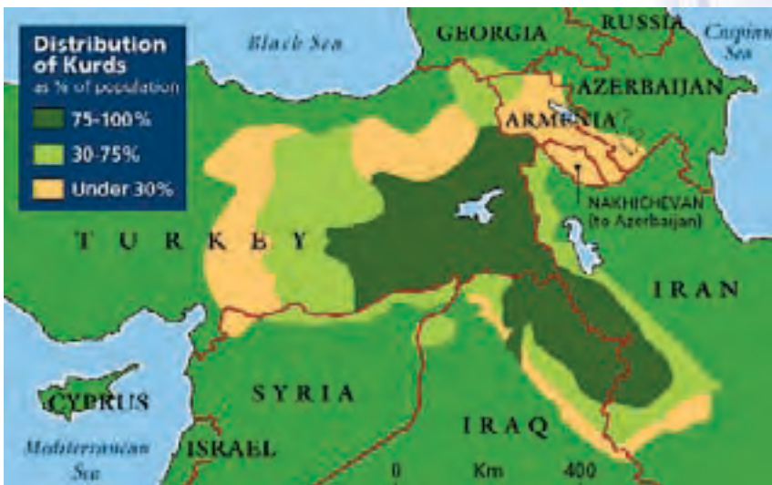
Χάρτης 2: Το σιτικό στοιχείο καταλαμβάνει το Νοτιο-ανατολικό τμήμα του Ιράκ, ενώ στο Νοτιο-δυτικό τμήμα αναμιγνύεται σχεδόν ισομερώς με το αραβο-σουνιτικό στοιχείο.

Το αραβο-σουνιτικό στοιχείο διαθέτει μια ελαφρά παρουσία στο Βόρειο Ιράκ, η οποία οφείλετο στην «ειδική πολιτική» μετακινήσεως αραβικών πληθυσμών προς τις κουρδικές περιοχές και στους εκπατρισμούς και τις εκκαθαρίσεις στις οποίες υπέβαλε το κουρδικό στοιχείο του Β. Ιράκ ο Σαντάμ Χουσεΐν. Οι διάφορες διεθνείς πηγές και παρατηρητήρια εκτιμούν ότι από το 1980 έως το 2003, δολοφονήθηκαν ή «εξαφανίσθηκαν» (πράγμα που είναι σχεδόν το ίδιο εφόσον οι εξαφανισθέντες δεν έχουν εμφανισθεί ούτε μετά την πτώση του καθεστώτος Σαντάμ) περί τα 300.000 άτομα.