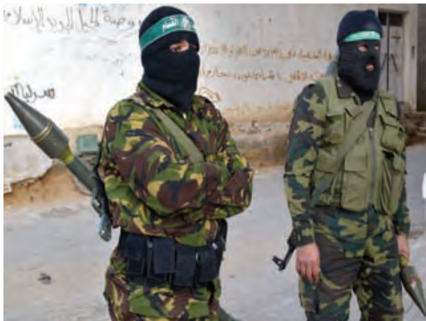
Παλαιστίνιοι Μαχητές της Χαμάς.