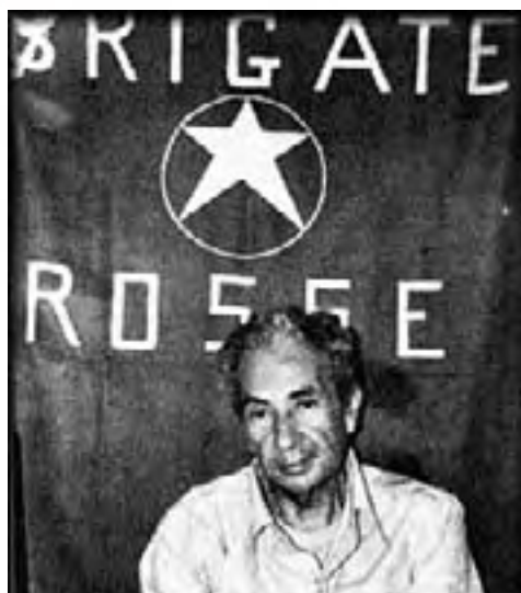
Ο Άλντο Μόρο κατά τη διάρκεια της ομηρείας του από τις Ερυθρές Ταξιαρχίες.

η «αξία» του ως στοιχείο «προστασίας των Λαών», νοούμενη έστω και ως μεταβατική φάση των κοινωνιών, γίνεται απολύτως αποδεκτή ως κίνητρο βίας.