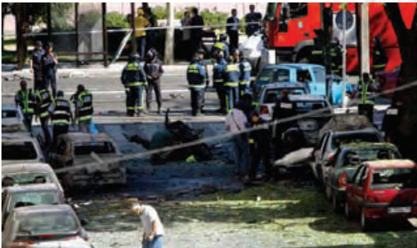
9 Φεβρουαρίου 2005. Έκρηξη λαγιδευμένου αυτοκινήτου σε προάστιο της Μαδρίτης. Την εοθνή ανέλαβε η βασική αυτονομιστική οργάνωση ETA.