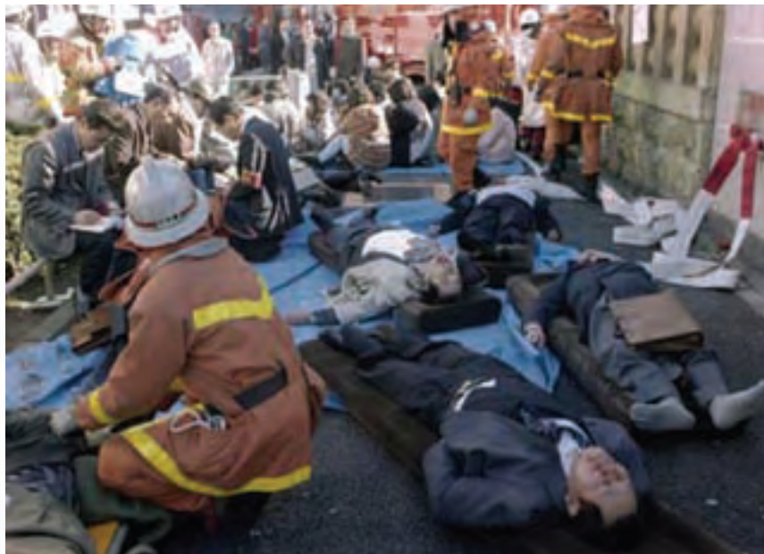
20 Μαρτίου 1995: Η τρομοκρατική επίθεση με το δηλητηριώδες αέριο Σαρίν στο σιδηροδρομικό σταθμό του Τόκιο, αφήσε πίσω της 12 νεκρούς και 6000 τραυματίες

7. Ως προς το χρονικό τους προσδιορισμό, η τρομοκρατική δράση στρέφεται κατά: