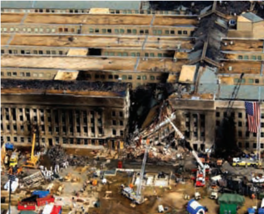
11 Σεπτεμβρίου 2001: Η συντριβή της πτήσεως 77 των Αμερικανικών Αερογραμμών στο Πεντάγωνο.

• Ενσωμάτωση και αποξένωση, ταυτοχρόνως: οι χώρες αυτές χαρακτηρίζονται συχνά από Άμεσες Ξένες Επενδύσεις, που συγκεντρώνονται σε οικονομικά κέντρα και εξειδικεύονται σε έναν ή δύο παραγωγικούς κλάδους. Κατά γενικό κανόνα, οι μη αστικές περιοχές υποφέρουν από έλλειψη επενδύσεων, ενώ τις χώρες αυτές χαρακτηρίζουν μεγάλες ανισότητες μεταξύ των διαφορετικών ομάδων και περιοχών.