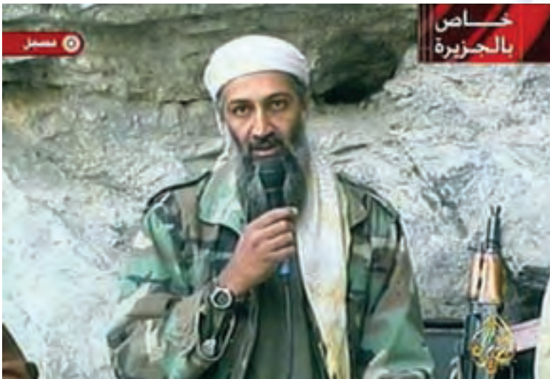
Διάγγελμα του Μπίν Λάντεν μέσω του Αλ Τζαζίρα

Συνοψίζοντας, μια περιληπτική θεώρηση της τρομοκρατίας, θα μπορούσε να καταλήξει στον εξής συνοπτικό ορισμό: