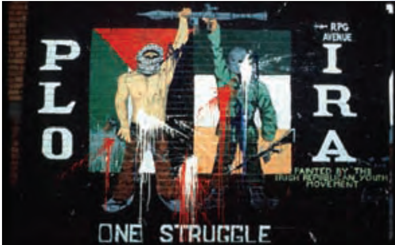
Γκράφιτι που απεικονίζει τη συστράτευση των Παλαιστινιακού Απελευθερωτικού Μετώπου με τον Ιρλανδικό Δημοκρατικό Στρατό.

των πρώτων, (όπως άλλωστε, και στην περίπτωση των καθολικών Πολωνών έναντι των Προτεσταντών Πρώσων ή των Πατριαρχικών Ελληνομακεδόνων έναντι των Εξαρχικών Βουλγαρομακεδόνων κ.λπ.). Και στις δύο αυτές περιπτώσεις, λοιπόν, τα αίτια της τρομοκρατίας είναι πολιτισμικής φύσεως χωρίς, βεβαίως, τούτο να σημαίνει ότι υποτιμώνται οι κατά περιστάσιν πολιτικές και οικονομικές συνθήκες.