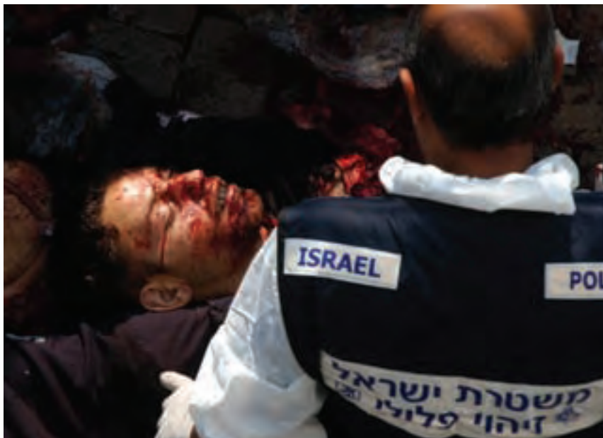
Παλαιστίνιος βομβιστής σε αποστολή αυτοκτονίας