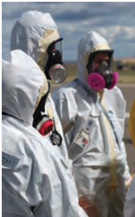
Εκπαίδευση για την αντιμετώπιση ενδεχόμενης βιοχημικής τρομοκρατικής επίθεσης

1. Η Πυρηνική Τρομοκρατία ( nuclear terrorism ) και η Βιοτρομοκρατία ( Bio-terrorism ) αποτελούν απλώς τις σύγχρονες εκδοχές της «συμβατικής» τρομοκρατικής απειλής, που εστιάζονται, επίσης, σε πολιτικο-οικονομικά κίνητρα και αίτια, και οι οποίες δύνανται να επιδράσουν άμεσα και καταλυτικά -λόγω της δυνητικής έκτασης των πληγμάτων- στο σύνολο της κοινωνικής, πολιτικής και οικονομικής οργάνωσης ενός κράτους.