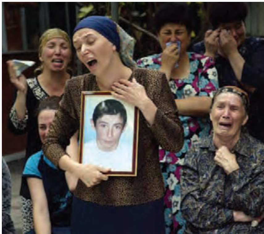
3 Σεπτεμβρίου 2004: Τσετσένοι αυτονομιστές εισβάλλουν στο σχολείο του Μπεσλάν, στη Βόρεια Οσετία. Απολογισμός αίματος: 326 νεκροί και πάνω από 600 τραυματίες.