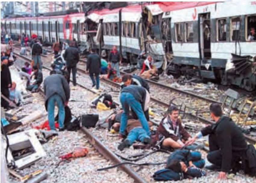
11 Μαρτίου 2004: Δέκα βόμβες εξερράγησαν σε ώρα αιχμής σε τέσσερις αμαξοστοιχίες στη Μαδρίτη, με απολογισμό αίματος 191 θύματα και 1.800 τραυματίες.

«Η τρομοκρατία μπορεί να θεωρηθεί ως ακραία μορφή έκφρασης, η οποία κατά κύριο λόγο αντιτίθεται στις αξίες της δημοκρατίας, του πολιτισμού και της ανθρωπότητας».